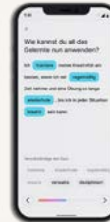
Audioformat: Alle interaktiven Einheiten sind auch als Format zum Hören verfügbar.