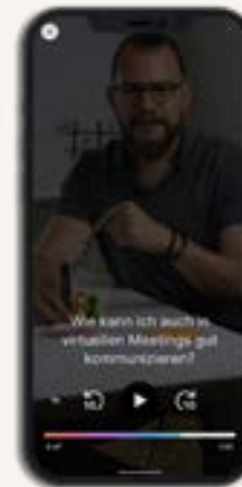
Videoformat: Expert:innen geben in kurzen Sequenzen Impulse.

Mit sparks ist Lernen über verschiedene Sinneskanäle möglich. Individuelle Lernpräferenzen und die momentane Lernsituation werden berücksichtigt: Je nachdem, in welcher Situation der:die Nutzer:in der App sich gerade befindet, kann das am besten geeignete Format für die Inhalte ausgewählt werden.